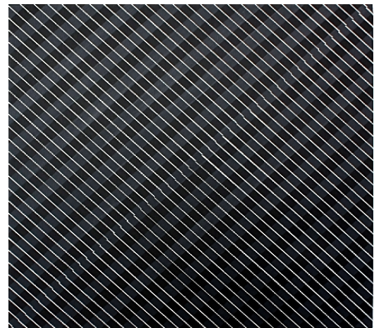
Diagonalverschiebung; 2011, Acryl auf Leinwand, 80 x 80 cm

Durch die gleich bleibenden Abstände der parallel angeordneten Linien wird eine Einheitlichkeit im Bild hergestellt, wechselnde Streifenkombinationen in dünn aufgesetzter Farbe gliedern das Bild in horizontaler oder vertikaler Richtung, neuerdings haben sich Diagonalen dazu gesellt, welche die Farbe noch stärker in das Weiß des Raumes hinaus führen sollen.